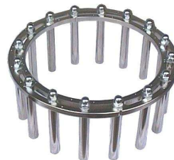
J-ring med stillbare stenger