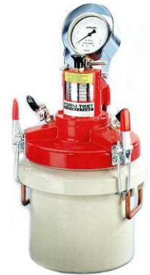
FTS luftporemåler 8ltr