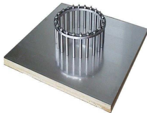
A2501-0530 Arbeidsplate og A2501-0500 J-ring