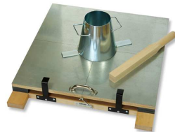
Fallbord med kjele og stamper