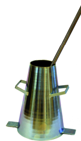
Slumpkjele og stikkstang