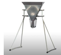
V-trakt for SKB prøving